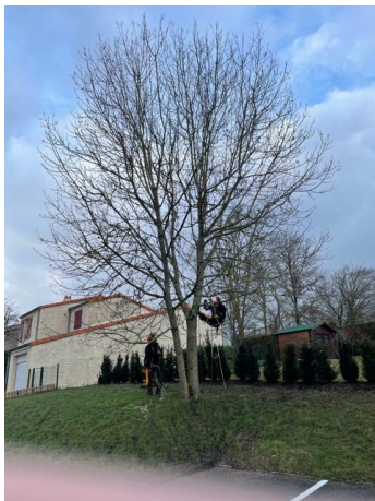
Elagage d'un arbre, rue de la Planchette