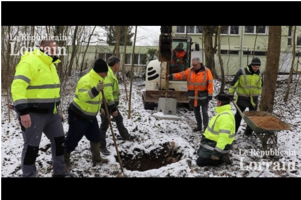
Ouvriers communaux et élus bravent le froid pour installer les fondations des tables de lecture du sentier de découverte.

Le compte à rebours est entamé avant le 2 mai, qui verra l'inauguration officielle du Musée naturel Jean-Marie-Pelt.