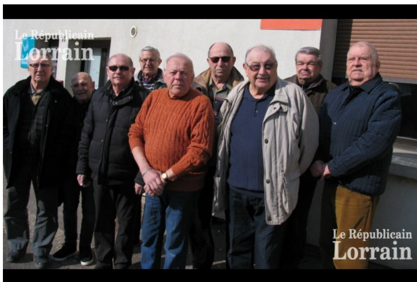
Le nouveau comité au complet

OGY-MONTOY-FLANVILLE. — La section UNC d'Ogy-Montoy-Flanville, Retonfey, Noisseville et Coincy a tenu son assemblée générale.