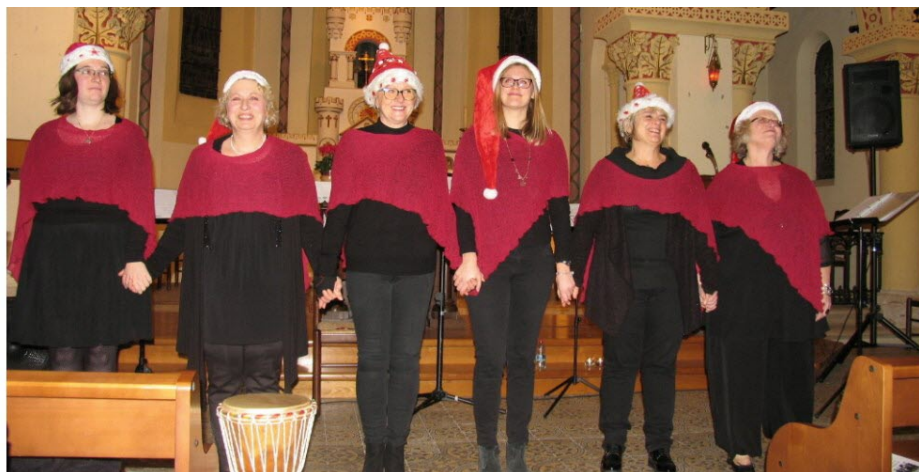
Le chœur de femmes Vox Femina.

Le chœur de femmes Vox Femina organise un week-end festif au village en vue des fêtes de Noël. Samedi 23 novembre, Vox Femina donnera un concert de Noël, à 20 h, à l'église de Saint-Agnan à Ogy. Entrée libre, un chapeau circulera.